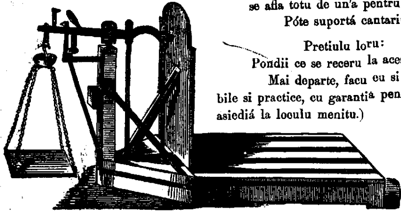
Cantariu decimalu cu podu in patru coltiuri

Mai departe facu si am depositu de cantarie pentru vite cu parieti spre a cantari pe ele boi, vaci, porci, vitiei, oi, facute den feru faurit, esaminate si timbrate de c. r. oficiu pentru autent. mesurcloru in Viena, cu garantiá pentru dicce ani.