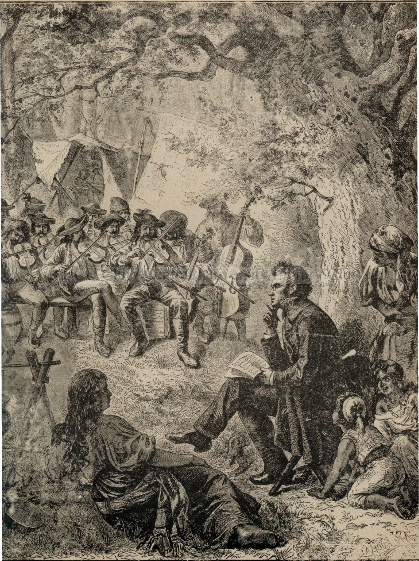
Unu artistu intre musicantii de sate.