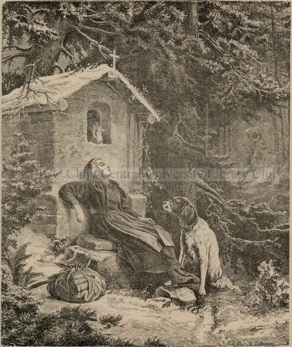
CREDINTIOSULU SOȚIU DE CALETORIA.