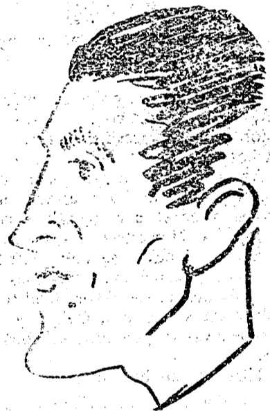
Glasz a skót csatár

biztosította. A nyári szezonban néhány új szerzeménnyel frissült fel az együttes, ami igen nagy hasznára volt mert őszi startja kitűnően sikerült. Első mérkőzésén a Juventus verte meg 2:1 arányban, a második pedig megérdemelt győzelmet aratott, 3:2