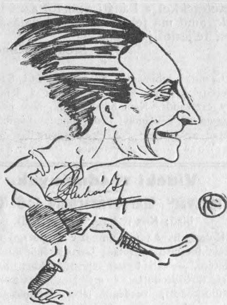
PLUHÁR ISTVÁN a külföldi események tudósítója