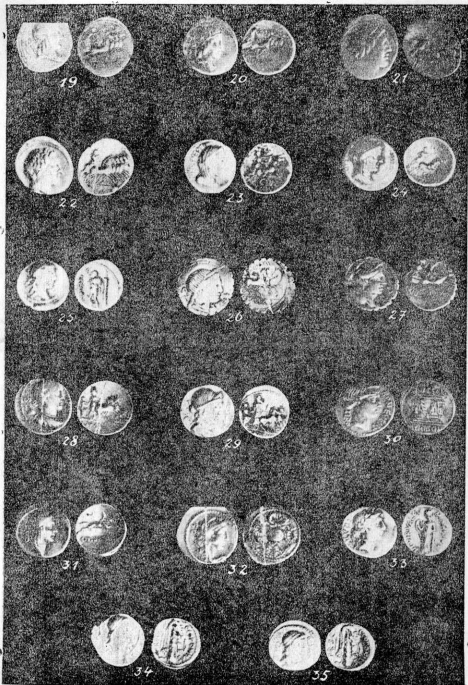
TABLOUL II. — Buletinul Societății Numismatice Române 1947.