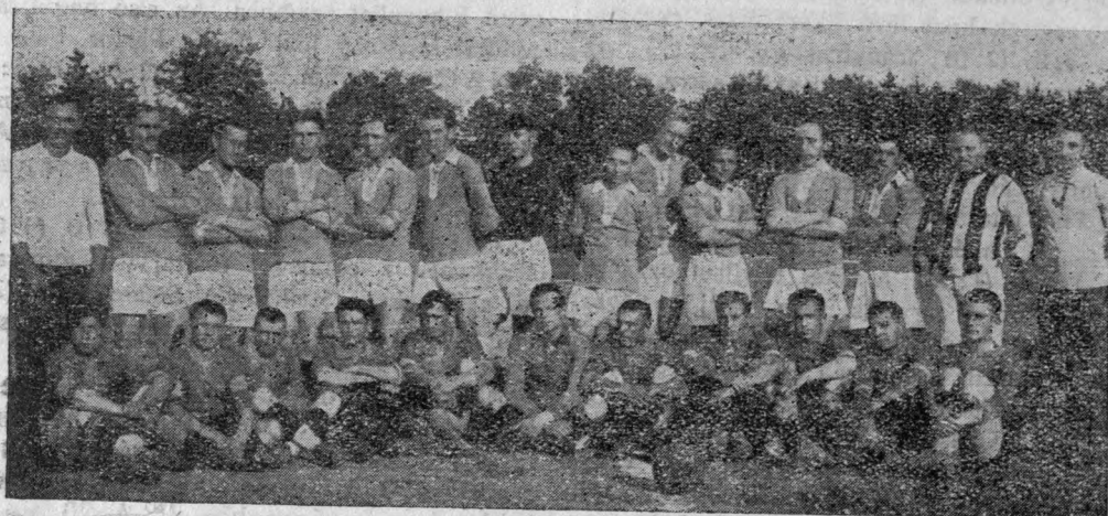
A KINIZSI és a VICTORIA csapatai az országos döntőben. Kinizsi győzött 5:1 (2:1)

A helyből magasugrás a nyakigláb emberek sportja. A rekordot ebben is Amerika tartja R. Ecory 165 és Platt Adams 163 cm-vel. Nehéz már a felállítást is eltalálni, mert ha messze állunk a léctől, úgy ráesünk, ha közel állunk, úgy alólról verjük azt le. Itt az arany középutat keressük. Az elugrás mindkét lábbal történik. A duplázás szabálytalan s a lécfelület fölé lábunkat csak akkor igyekezünk átemelni, ha mindkét lábunk már a levegőben van. A test csipőben kissé meghajlik (a lécfelület felé) és midőn mindkét lábunk a lécfelület fölé van, a lendítő lábát leeresztjük, az elugró lábát még jobban felrántva igyekezünk testünket a léctől minél távolabb juttatni. Halálugrás és tigrisugrás szabálytalan, ugyisintén a nem páros lábbal egyszerűen történő ugrás is.