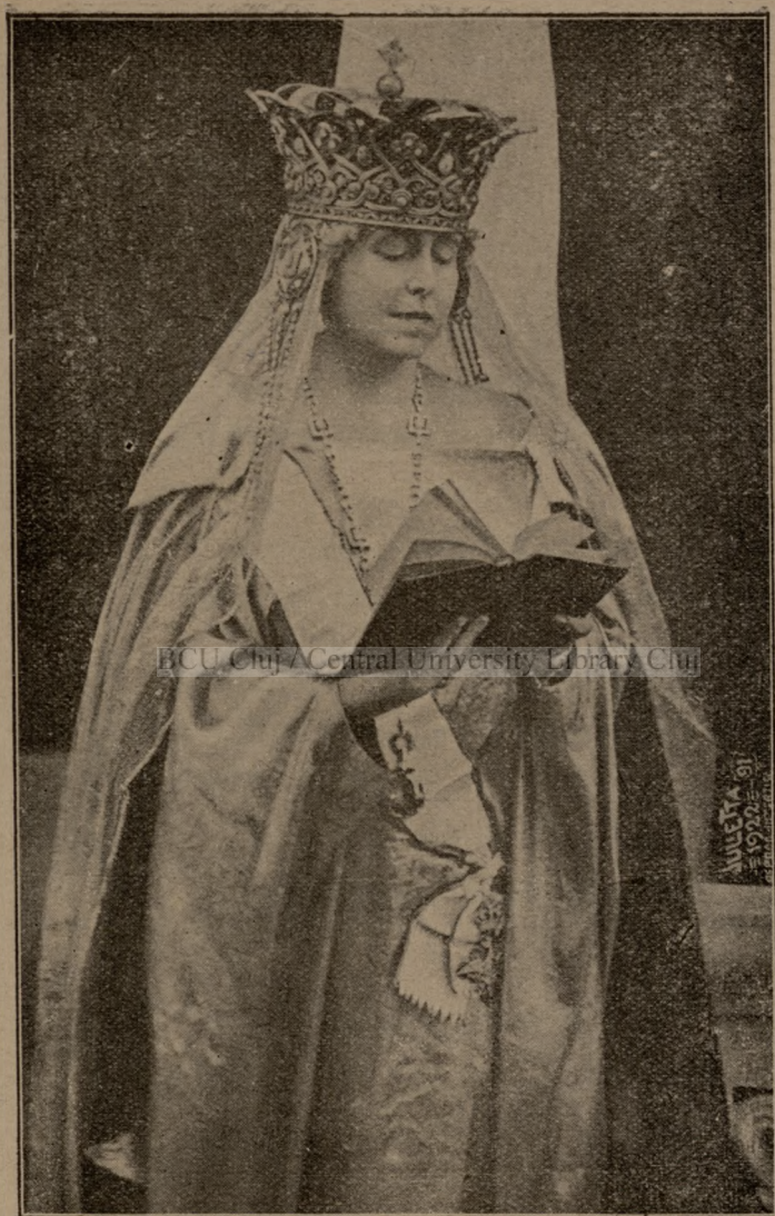
MAIESTATEA SA REGINA MARIA AUGUSTA PATROANĂ A REUNIUNII FEMEILOR ROMÂNE DIN BEIUȘ ȘI JUR.