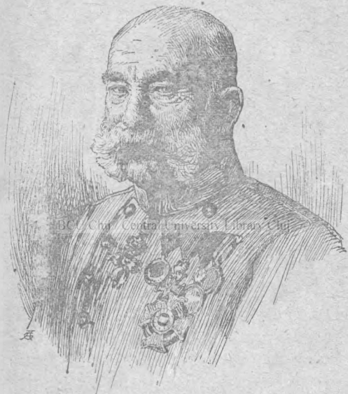
M. S. Impăratul Francisc Iosif I.