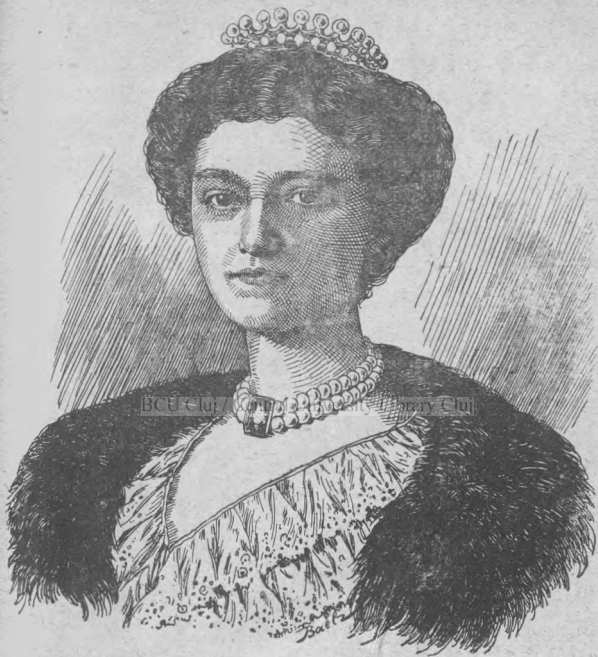
M. S. Impărăteasa Zita.