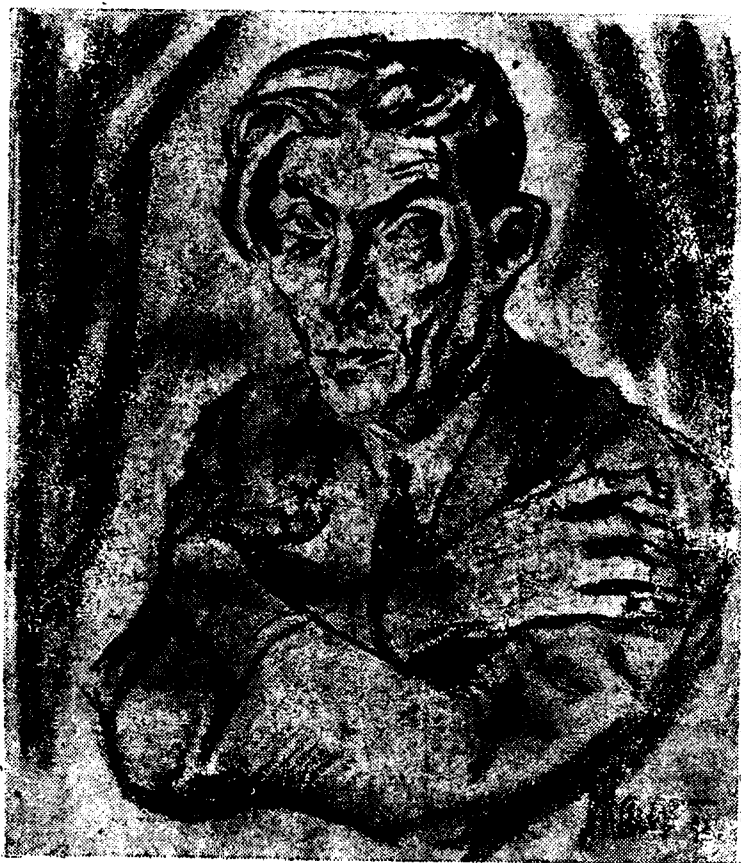
Desen de S. Maur