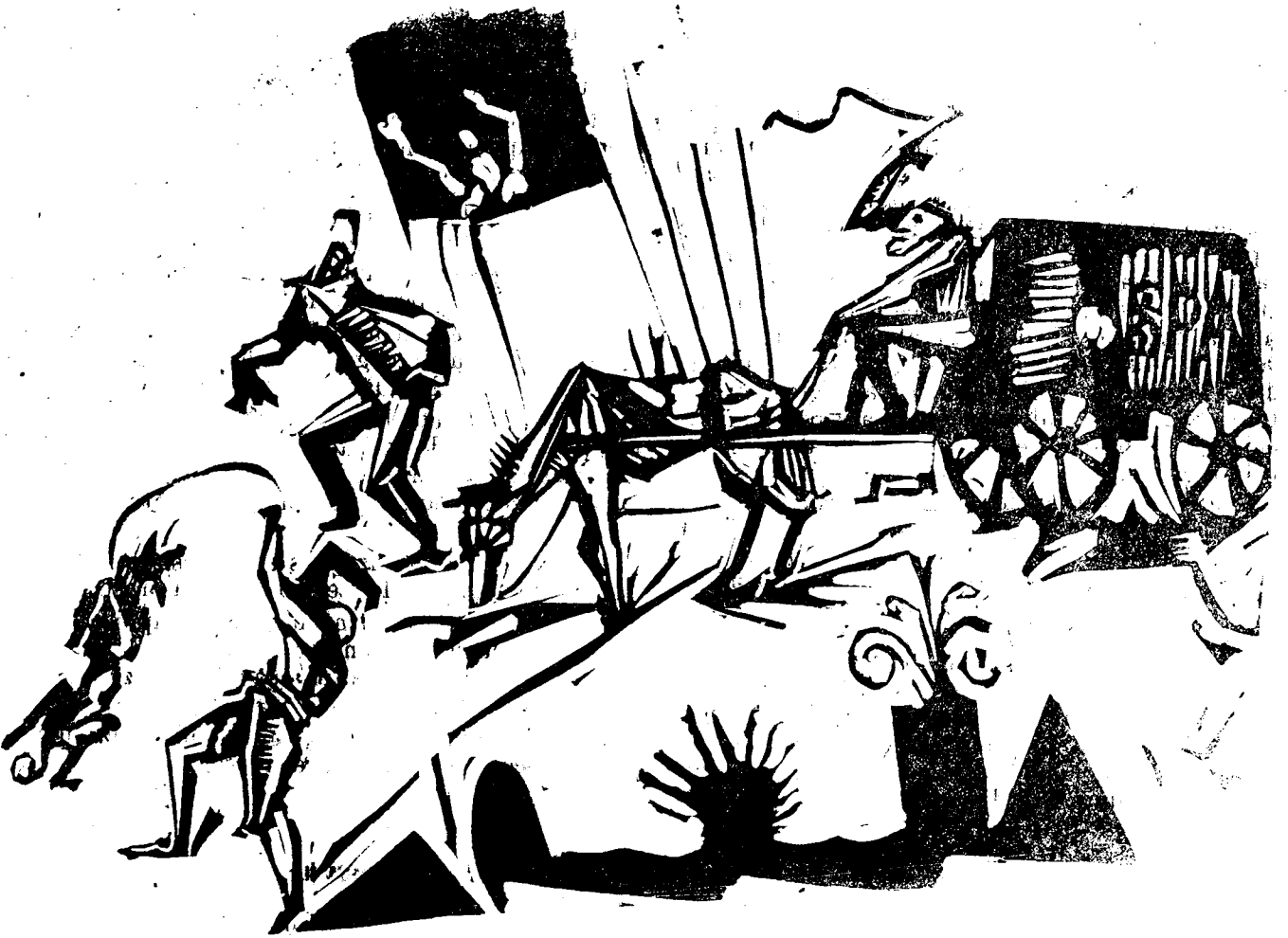
Hingherli. Xilografie originală de Marcel Iancu