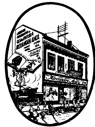
Casa de editură ALEXANDRU ANCA