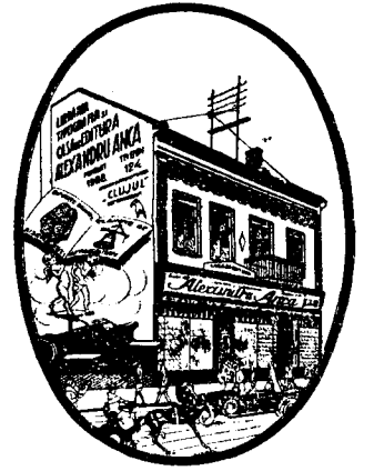
Casa de editură ALEXANDRU ANCA