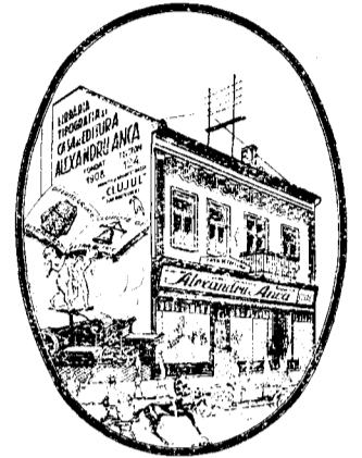
Casa de editură ALEXANDRU ANCA