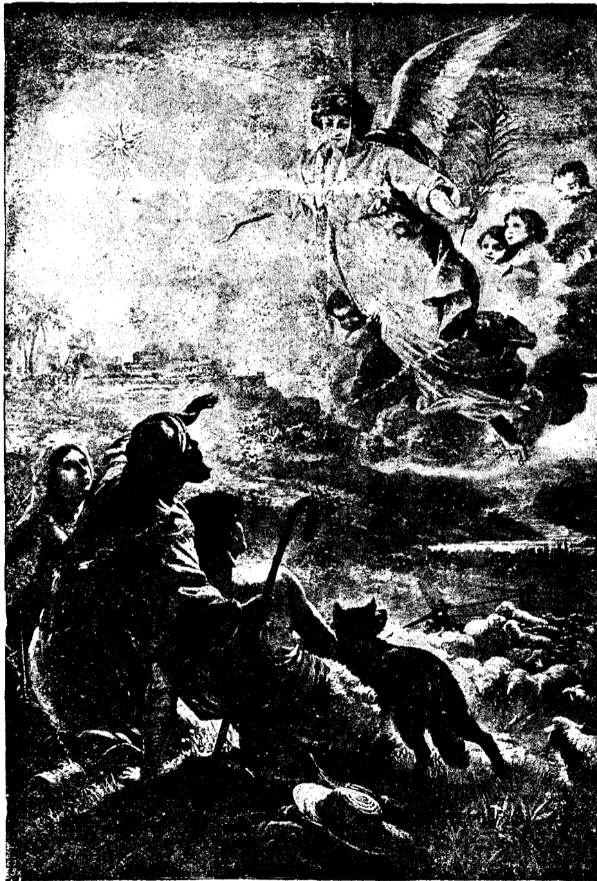
Corul ingeresc anunțând păstorilor vestea de salvare a omenirii

Cu astfel de perspective viitorul omenirii se anunță întunecat. El rezervă lumii perioade de fer și mai groaznice decât cele cunoscute până acum în istorie. Dacă în adevăr toate acestea s'ar produce și dacă nu s'ar ivi omul care să-i scoată pe oameni din nebunia lor și să-i salveze din starea actuală de egoism și mândrie desăvârșită atunci cu adevărat am putea spu-