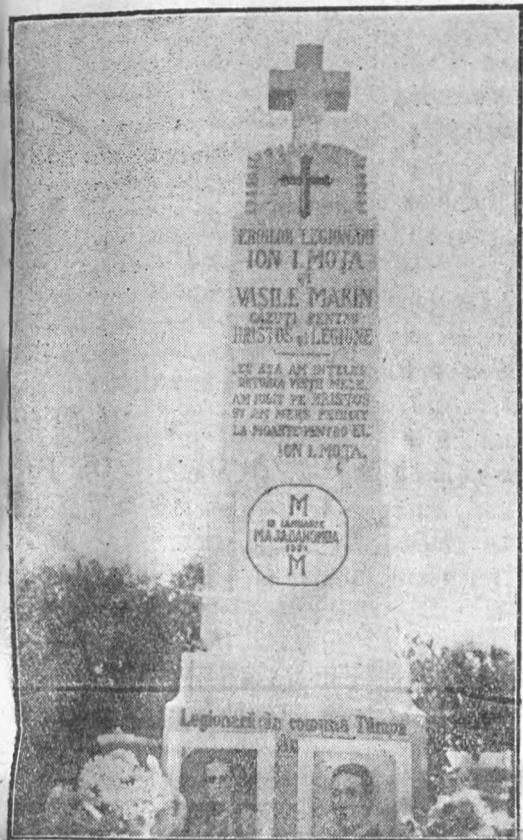
Monumentul Moja-Marin dela Tâmpa — J. Hunedoara cu scrisoare aurită bogată. Jos mărțișorul „Majadahonda” M-M... din marmoră albă, cu scrisoare de aur pe el.