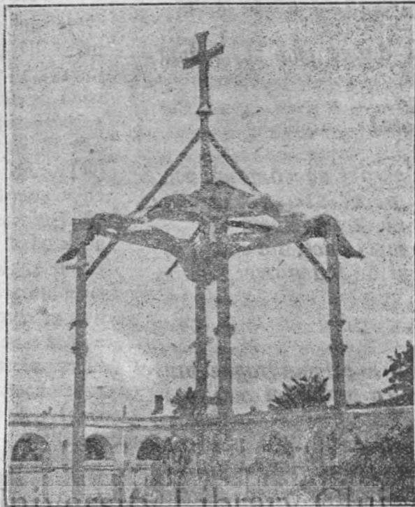
Baldachinul după ce a ars. — Au rămas numai stâlpii de latură și vre-o 3 căpriori, cari s'în dreaptă și înălțată spre cer sfânta Cruce!.. Până au ars toate în jurul ei, coperișul întreg, — ea a stat în val de flăcări, cari însă pe ea nu au mistuit-o, nici căpriorii cari s'o țină sus!.. — Mare ești Doamne și minunate sunt lucrurile Tale!

o față, pe cea despre miază-zi, iar cea despre răsarit e ca și neatinsă! Chiar o parte din hârtia în care fusese învelită sf. Cruce, a rămas neatinsă. Multă lume merge de se uită și se miră, de minunea ce a făcut-o Dzeu aci. Că dacă furia unei furtuni a putut atinge printr'un fulger baldachinul