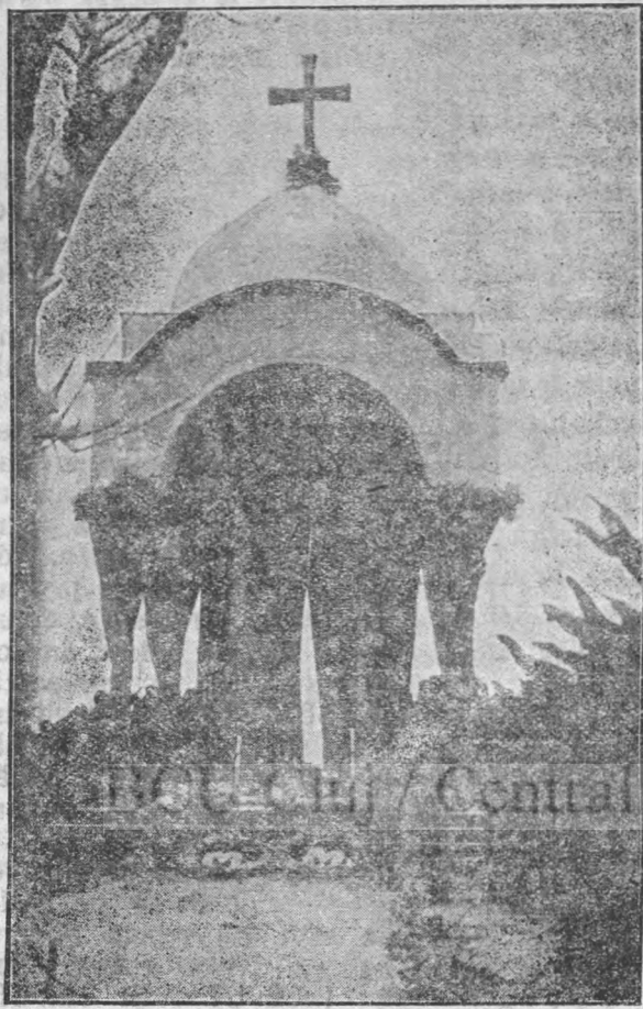
BALDACHINUL ÎNAINTE DE A FI ARS

Care nu fu uimirea celor dela Casa Verde și din împrejurimi, când văzură