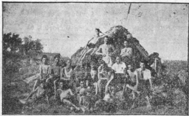
În timpul repausului, în fața colibei, legionarii fac să hulască văile cu cântecele lor.