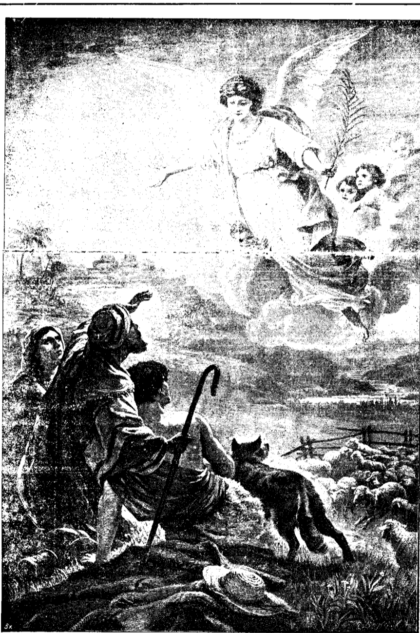
Ingerii vestesc păstorilor vestea cea minunată.

Întru toate asemenea nouă, a mân- cat, beut, s'a bucurat, întristat și plâns,