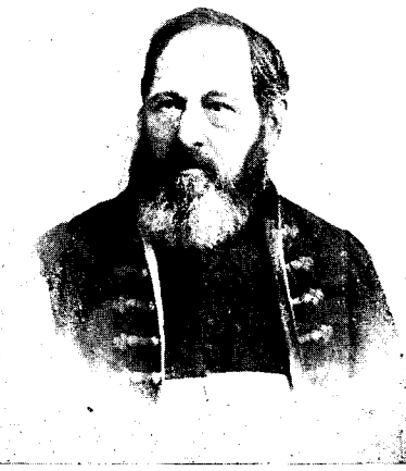
† Ioan V. Russu.

Nu-mi da apotecarul, cere recept dela doftorul. Pentru-că, panem-casul, că aș lua o jumătate de chilă din acei praf alb, aș păți-o. M'ar otrăvi. Deci ca nu cumva să-mi înveninez organismul,