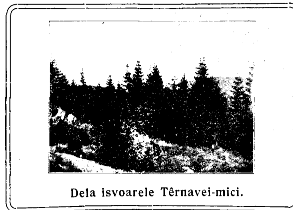
Dela izvoarele Têrnavei-mici.

Suntem pe vremea, când plugarul își adună roada din grâul sămănat cu sudoarea feței sale. O bucurie îi cuprinde sufletul, când vede, că grăunțele ce le-a dus azi toamnă cu sacul în spate, pământul i-le dă înzecit. Cu lacrimi multămește Stăpânului naturii, că deși cu mâni nevrednice a aruncat sămânța, nu a înăbușit-o în brazdă, ci i-a dat putere să încolțească și roada sê-i aducă. Minune este aceasta; faptă minunată în ordinea naturii, cu care atât de mult ne-am dat, încât ni-se pare un lucru de toate zilele, deși este produs de aceeaș putere d-zeească, ce a înmulțit în scurt timp câteva pâni, de s'au săturat peste 5 mii