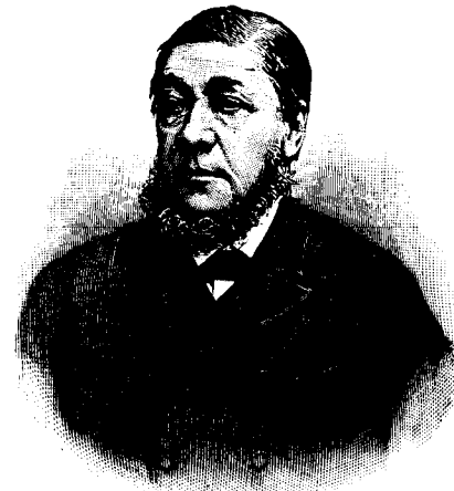
† Paul Krüger.

Să nu se simtă oare lipsa de a mai lumina aceasta împărăție a sufletului vecinic, de a mai plivi din acestea burueni, pe cari azi așa de puțini le bagă în samă? Să nu fim noi oare vrednici, ca să ne ridicăm odată pe înălțimea, de pe care să vedem limpede și să cunoaștem, cari sunt adevăratele noastre lipse și ajutoare , pe cei ce nu voesc binele, și pe cei ce voesc să trăească de pe spinarea noastră? Să nu fim oare vrednici, ca odată să nu mai stăm răci și nepăsători atunci când e vorbă de sufletul nostru, de fericirea noastră? Ar fi bine, nu-i vorbă să avem mai mult loc, să putem presăra totuși mai multe știri mai însemnate din țară și din străinătate. Am dori să ne rămână loc mai mult pentru »foiță«, dar cu spațiu, de care dispunem acum, facem cum numai se poate. Dela sprijinul, ce ni s'ar da,