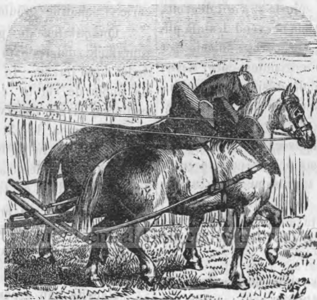
ARATRU (PLUG) CU CAI

Cultura graului este d'o importanță cu atît mai mare în țerra noastră, cu cît ea constituie baza fundamentală a avuțiilor noastre, în comparație cu inferioritatea în care se află artele și industria.