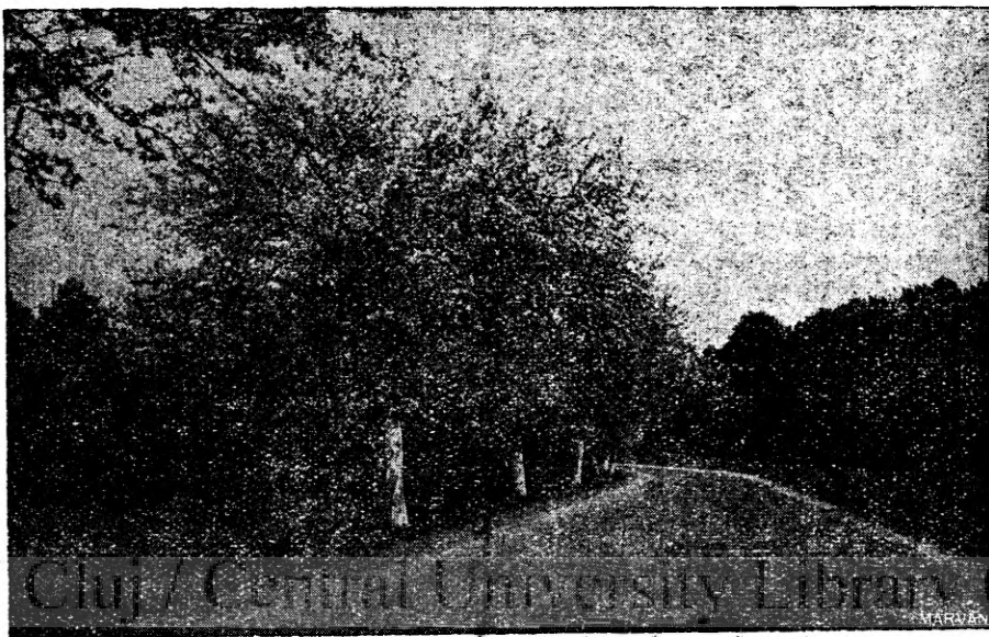
DRUMUL NAȚIONAL DINTRE VLĂDENI ȘI PERSANI

Ei nu se lăsau niciodată și porneau cu jalbe și pe unde credeau ei că li s'ar deschide o ușă pentru dreptate. „Li se arunca în față pecetele jal-