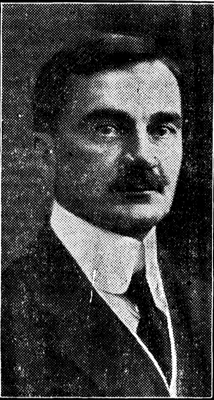
D-I IULIU MANIU.

Dovada o dă nu numai hotărârea neșămutată a imensei mulțimi a membrilor partidului nostru, ci și faptul că și-au anunțat participarea și alte partide politice și nenumărate persoane neînregistrate în vre-un partid politic. Stăm în fața unei crize a sistemului de guvernare. Cel mai puternic organism politic al țării și alături de el opinia publică a întregii țări vrea să-și spună cuvântul.