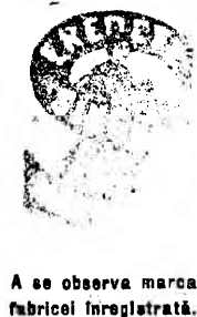
A se observa marca fabricii înregistrată.

mașine de cusut, Soc. pe acții, Brașov, Strada Porții nr. 23.