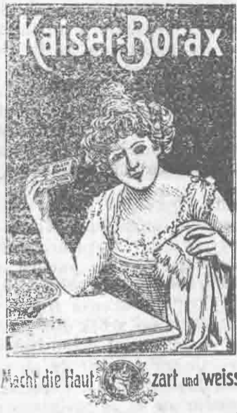
Macht die Haut zart und weiss