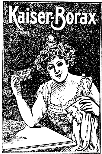
Macht die Haut zart und weiss

Abonamente la „Gazeta Transilvaniei“ se pot face ori și când pe timp mai îndelungat seu lunar.