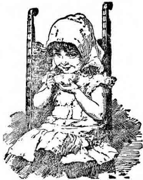
Mie-mi place mai mult!

Cine bea Kathreiner Cafeaua de maltă Kneipp