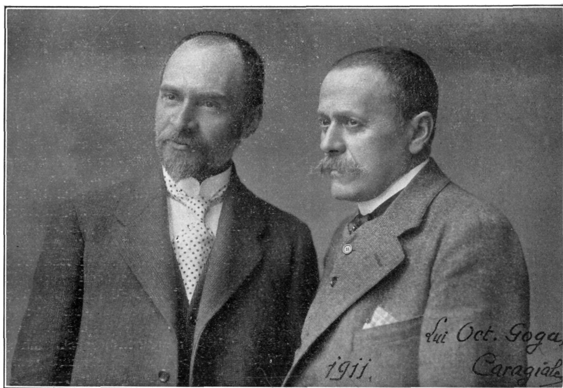
G. COȘBUC și I. L. CARAGIALE.