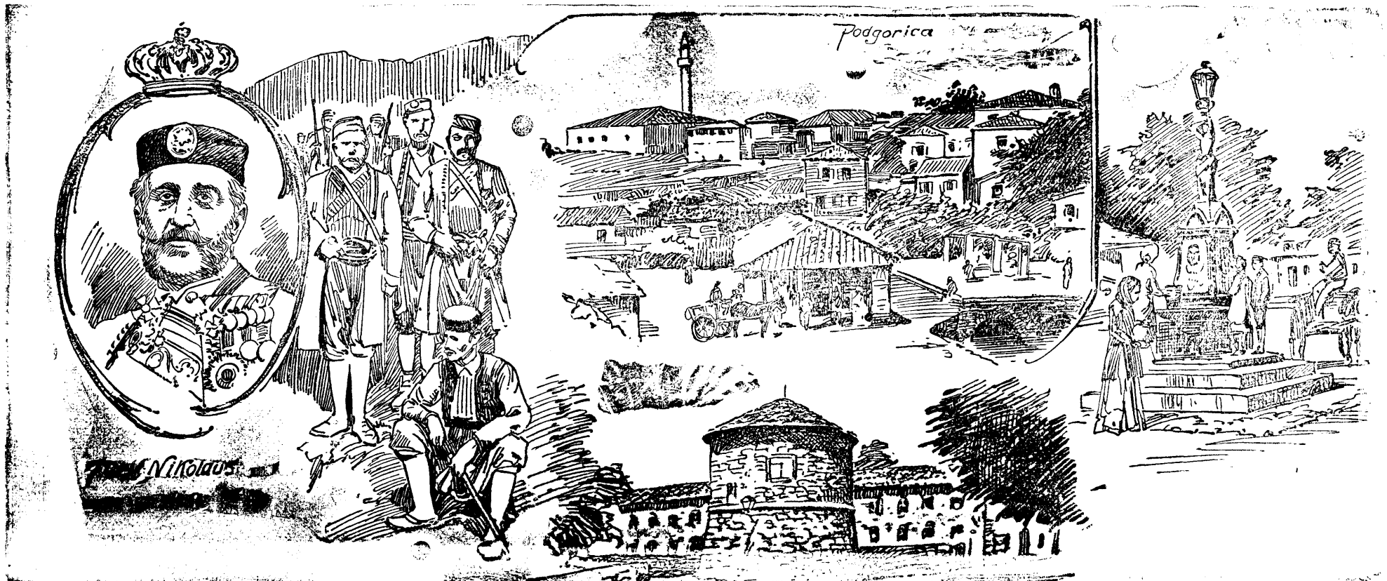
(Vezi articolul: MUNTENEGRU REGAT.)