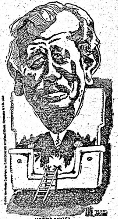
JACQUES SANTER, next President of the European Commission