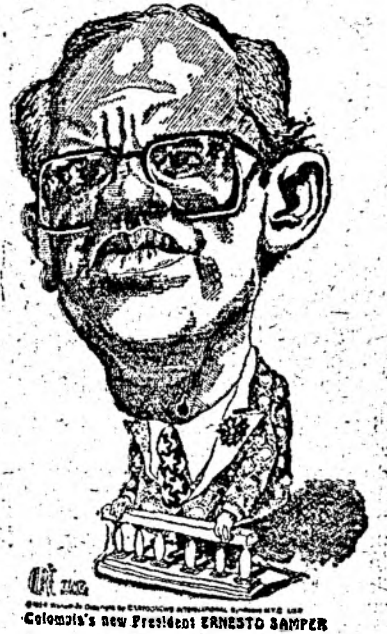
Colombia's new President ERNESTO SAMPER

La sfârșitul anului trecut, Ministerul Securității Publice a interzis și centrelor de tir, care s-au înmulțit în ultimii ani, să dețină arme de război. În aceste centre au fost comise ne-numărate furturi, în special în sudul Chinei, și unele dintre aceste arme au fost folosite pentru a comite jafuri în Hong Kong. Dar în politica directivei oficiale a ministerului, multe dintre centrele de tir, deschise sub oblăduirea armatei, continuă ca și pînă acum să propună amatorilor de tir puști AK-47, lansatoare de rachete sau chiar mitraliere grele.