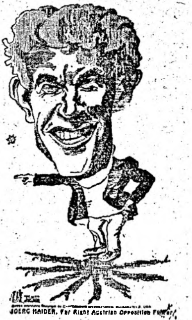
JOERG HAIDER, Far Right Austrian Opposition Leader