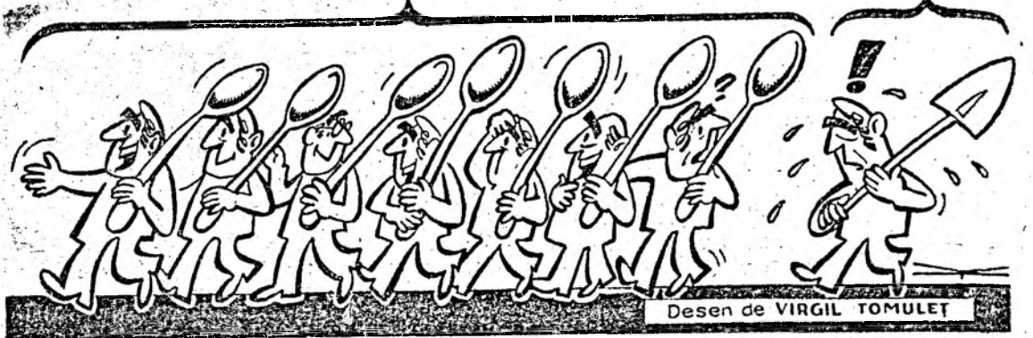
Desen de VIRGIL TOMULET