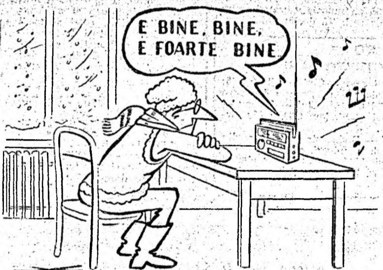
Iarna politică e mai aproape ca oricînd de noi Desen de Virgil TOMULEȚ

Comunitatea Evreilor din Cluj-Napoca organizează azi, 8 decembrie, ora 10, la Templul Memorial al Deportatilor din Cluj-Napoca, str. Horea nr. 21, Festivitatea Sărbătorii de HANUKA 5754 (1993). Predica festivă va fi rostită de Eminentă Sa, domnul