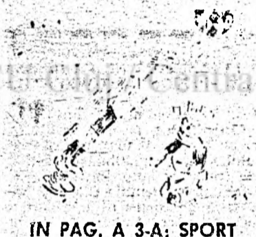
IN PAG. A 3-A: SPORT

Conform datelor statistice provenite de la Parchetul General al României, numărul inculpațiilor trimise în judecată a crescut cu 7,8 la sută în primul semestru al anului 1993. Au fost trimise în instanță 51.293 de inculpați. Cu alte cuvinte, din 100.000 de oameni, în România 221 dintre ei sînt infractori. În aceste condiții parcă nici nu ne mai vine să ne bucurăm pentru că infracționalitatea la Cluj este STAȚIONARĂ. Mai multe amănunte în pagina a 8-a.