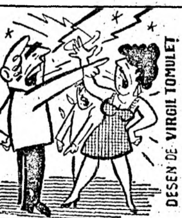
DESEN DE VIRGIL TOMULEI

Începutul campaniei electorale... sau impactul televizorului asupra electoratului.