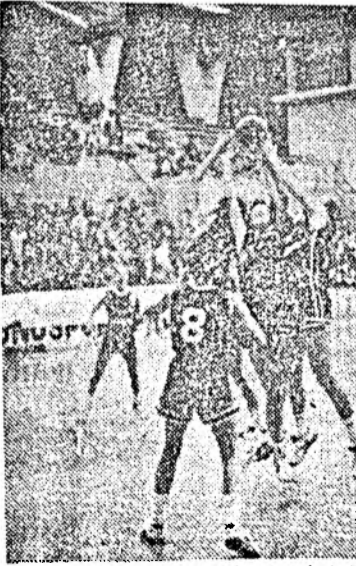
Secvență din partida feminină de joi seară, dintre „U-ACSA” și echipa franceză Challes-les-Eaux, în cadrul C.C.E., disputată în Sala Sporturilor. În pagina a 2-a: rubrica „SPORT”