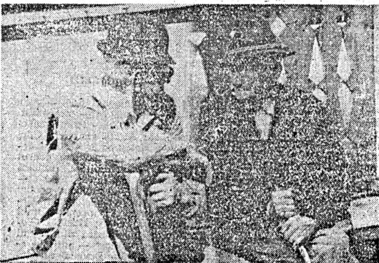
— Zici că s-au majorat pensiile?

Incertitudinea, tracasările zilnice, privațiunile la care bătrînii noștri sînt supuși le scurtează viața — aproape că nu mai e nevoie s-o spunem. Urmărește cineva acest lucru? Pe vremuri, în unele triburi primitive bătrînii erau urcați în copaci, copacii se scuturau bine și cine cădea ca un fruct stricat, ca fruc-