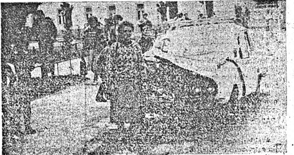
Neatenția costă... Dacă ar fi mers mai încet...