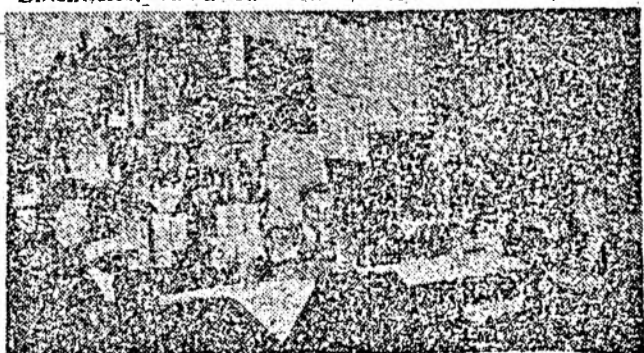
Aspect de la barul Restaurantului „Rapsodia”

— Se apropie sezonul estival. Ce noutăți ne oferiți? — Am deschis, grădina „Boema”, la 1 aprilie. Este pregătită grădina de vară Hoia. De asemenea, Chiosul Grădina 1 Mai funcționează și iarna. Avem unități încă în reparație, în renovare. Sperăm că pe 1 mai să deschidem Crîșul. Aici s-a lucrat mult, aproape un an de zile. În renovare mai este Pelicanul, în Mărăști, pe str. Dunării. Se lucrează bine la Someșul. Mai este înăuntru de făcut fîntina arteziană. Lucrările mari sînt făcute. Bineînțeles, odată cu restaurantul deschidem și terasa