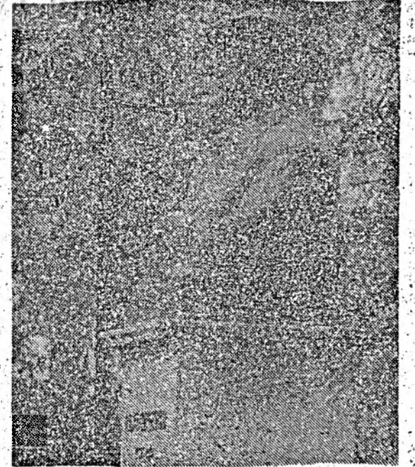
lingă alt lăcaș de cultură (Casa Tineretului sau Casa de cultură a studenților), pentru a fi cinstit așa cum se cuvine de toți cei care îi iubesc opera lui nemuritoare?

Oare edililor orașului nu le-a trecut niciodată prin cap că locul lui Caragiale nu este în acest „parc”, ci, eventual, în fața Teatrului Național sau