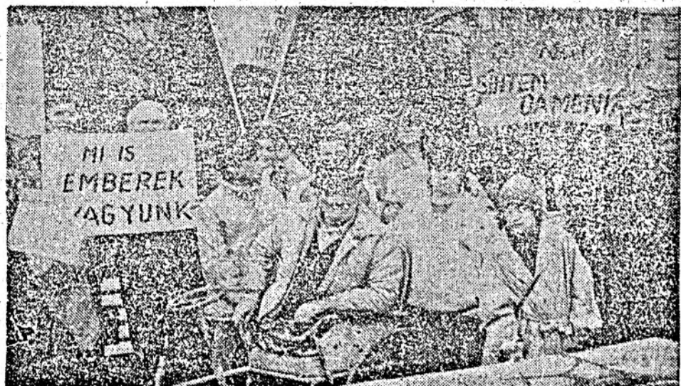
Surprinsă surprinsă de fotoreporterul nostru Radu SÂNTEJUDEAN la mitingul Alianței Civice (fotografia din stînga) și de lamarșul de protest organizat de Asociația pentru ajutorarea și protejarea handicapaților motori din Cluj