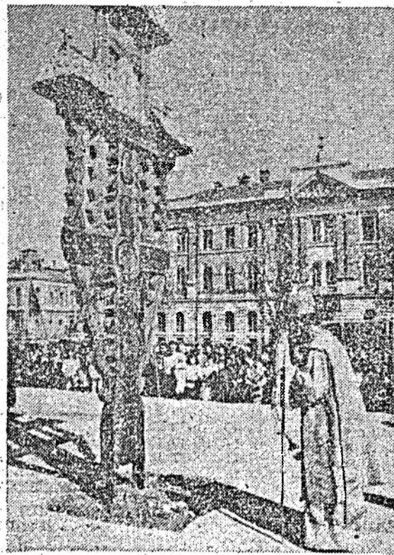
Sfîntirea Troiței Eroilor — monument oferit în dar de Uniunea „Valra Românească” — Filiala Maramureș.

Federația Organizațiilor Studentești din Cluj