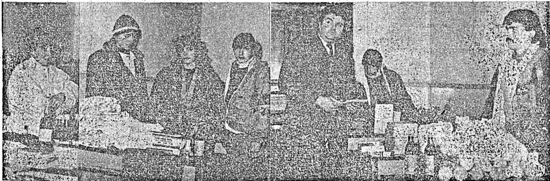
Aceste produse n-au ajuns în străinătate. Altele însă...