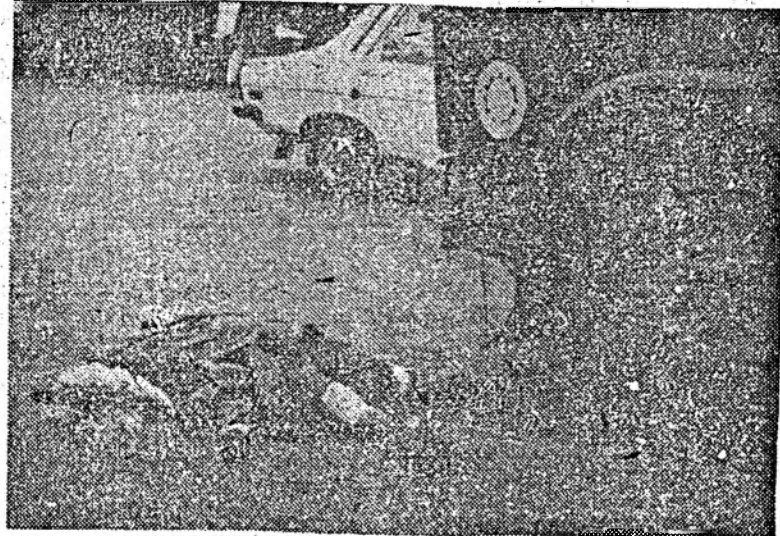
O manevră greșită și... rezultatul...

● A venit zăpada. Gîndiți-vă, stimați conducători auto, că și o banală tamponare, dar-mi-te accidente mai grave, sînt de nedorit. Deci, atenție!