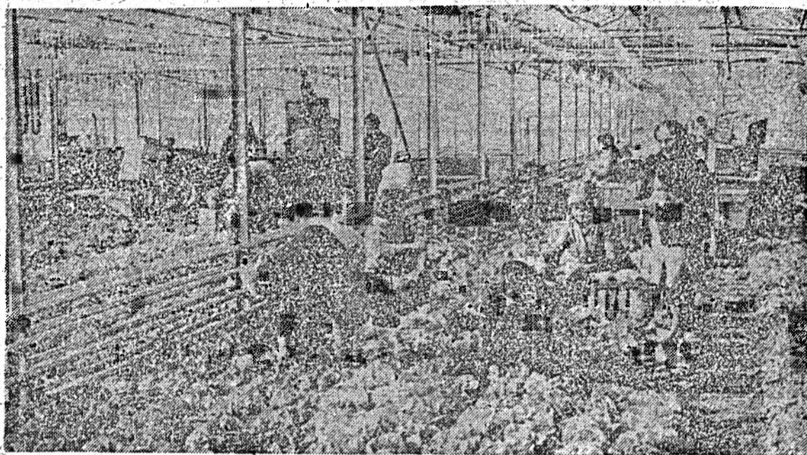
La serele din Cimpia Turzii se recoltează zilnic mari cantități de salată. Din păcate, însă, drumul salatei de la producător spre consumator este, încă, mult prea întortocheat. Legumicultorii din Cimpia Turzii au declanșat, de asemenea, pregătirile pentru producerea de răsaduri, sens în care se primesc comenzi ferme din partea asociațiilor profilate pe legumicultură, a agriculturilor particulare, a fermelor de stat, pentru producerea unor cantități nelimitate de răsaduri de legume.