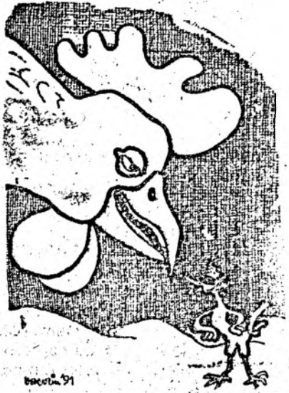
... și dacă vrei bătaie, arată-te !!! Desen de Mihail BACOCIU

culese de Demostene ȘOFRON (teze, extemporale, examene)