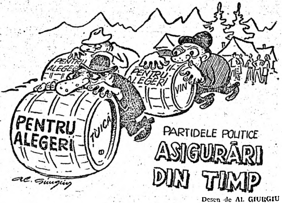
Desen de Al. GIURGIU

Intențiile celor doi nu au putut trece neobservate securității. Într-un raport detaliat, maiorul Trelocopie a informat amănunțit pe mui-marele iadului despre acțiunile vizînd înființarea unui partid în iad. După ce a parcurs informarea ce i-a fost prezentată, președintele iadului a notat pe colțul din dreapta a acestuia: „Aspectul relatat nu prezintă nici un pericol. Se vede că nu v-ați dat seama că aveți de-a face cu un nebum”.