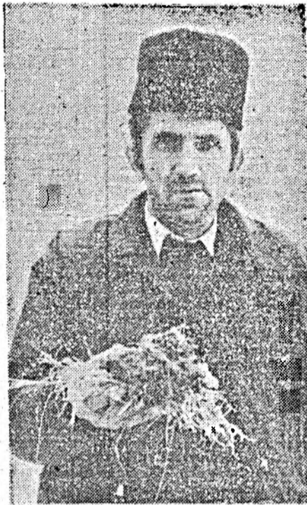
Pămîntul este, în sfîrșit, al țaranului...