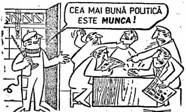
Desen de Virgil TOMULET