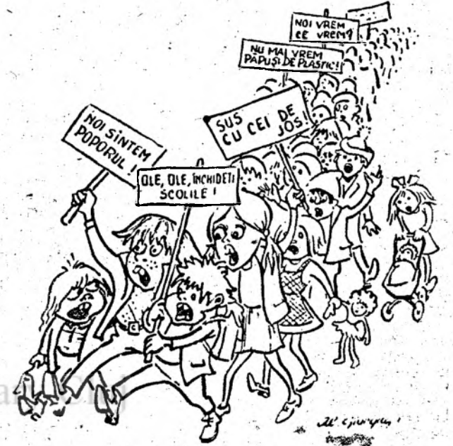
Desen de AL. GIURGIU

imediate luate pînă în prezent, cele care vor urma reconfirmă preocuparea acestui pentru îndreptarea-elevilor către o emulație școlară reală, nobilă, pentru reconsiderarea raporturilor dintre elev și profesor, dintre elev și școală, dintre familie (soțietate) și școală. Școala românească a îmbrățișat un drum nou, făcînd acest lucru din mers, cu un curaj extraordinar. Elevii își doresc dascăli autentici, viabili prin arta lor, prin cuvînte convingătoare, apropiate sufletului tînăr. O nebanuită maturitate transpare din aproape toate revendicările formulate de elevi. Am remarcat un limbaj stimulat permanent de gîndire dar și de imaginație, care, devenit de-acum un auxiliar al școlii, poate oferi certitudinea în realizarea viitoare a individului. Michaela BOCU