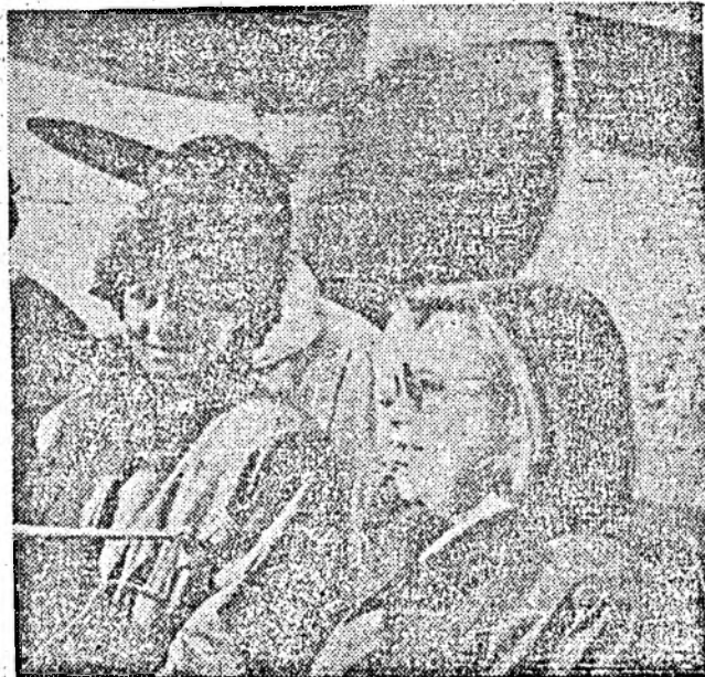
La Cluj au... zîmbit, la București au dat cu... Japca. Și cînd te gîndești că-s dilamari... Principese...